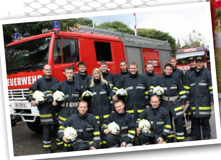
Mitglieder einer Feuerwehr

Wenn du jetzt annimmst, dass die/der Jugendliche Mitglied im „Sozialen Netzwerk Feuerwehr“ wäre, wo Anerkennung durch Wissen, Geschick, Sportlichkeit, ... errungen werden kann und wenn du dann die Kosten für die Sozialeinrichtung, die sich die Gesellschaft (also wir alle) ersparen, hat die Feuerwehr der Gesellschaft zu einem „Gewinn“ verholfen.