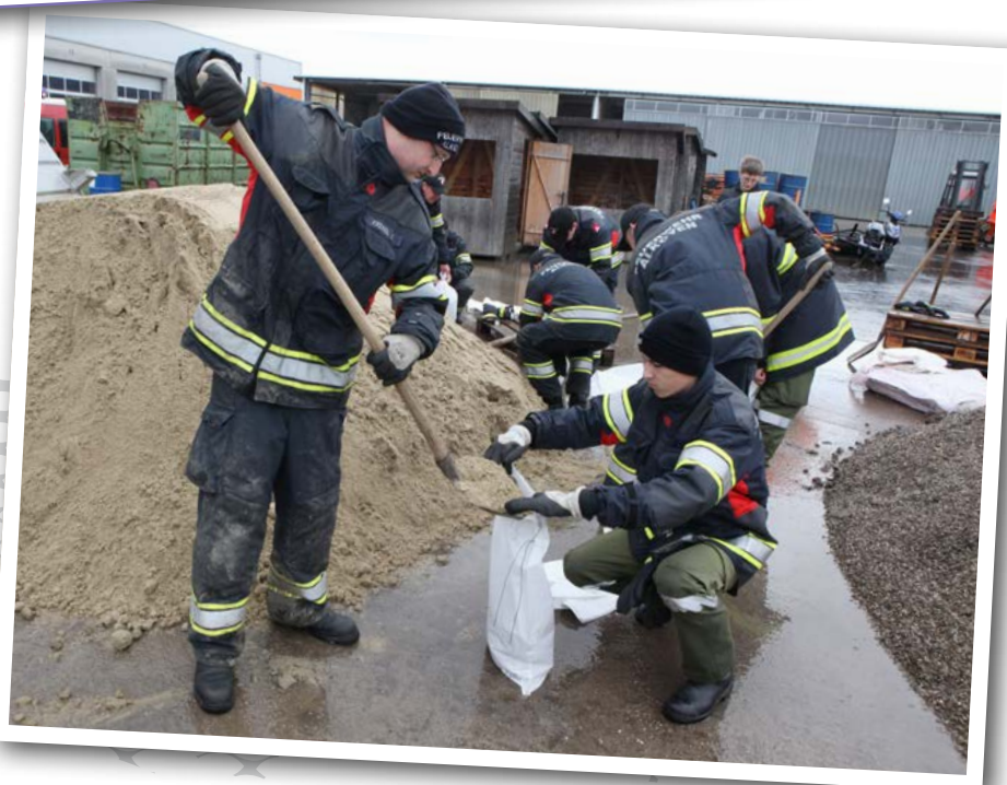
Sandsäcke werden für den Hochwasserdamm befüllt.

Um den „Gewinn“ zu errechnen musst du nur die Anzahl der Häuser (inklusive der Einrichtungsgegenstände, die nun nicht durch das Wasser unbrauchbar geworden sind) multiplizieren.