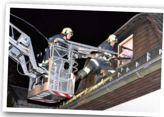
Personenrettung über die Drehleiter